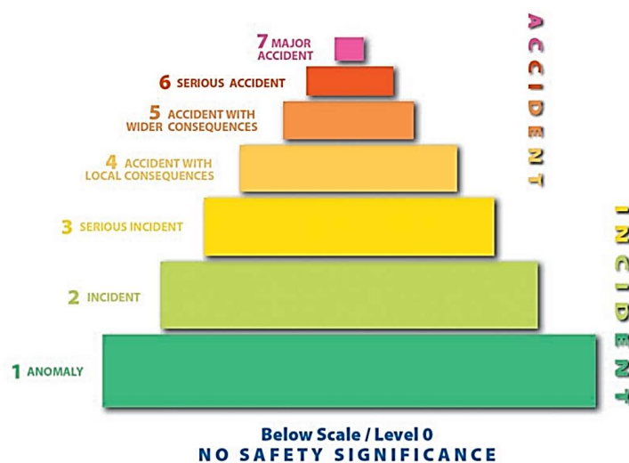
Abbildung 3: Grafik aus IAEA-INES-2009 (Titelbild)

Um die Öffentlichkeit schnell und verständlich zu informieren, hat die IAEA zusammen mit der NEA die internationale INES-Skala zur Bewertung von Störfällen geschaffen. Diese Skala wird weltweit genutzt und umfasst sieben Stufen. Je höher die Stufe, desto schwerwiegender der Vorfall. 473